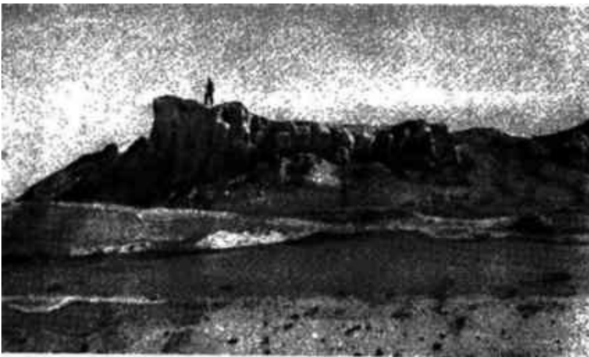
Развалины крепости Кой-Крылган-Кала (IV–III века до нашей эры)