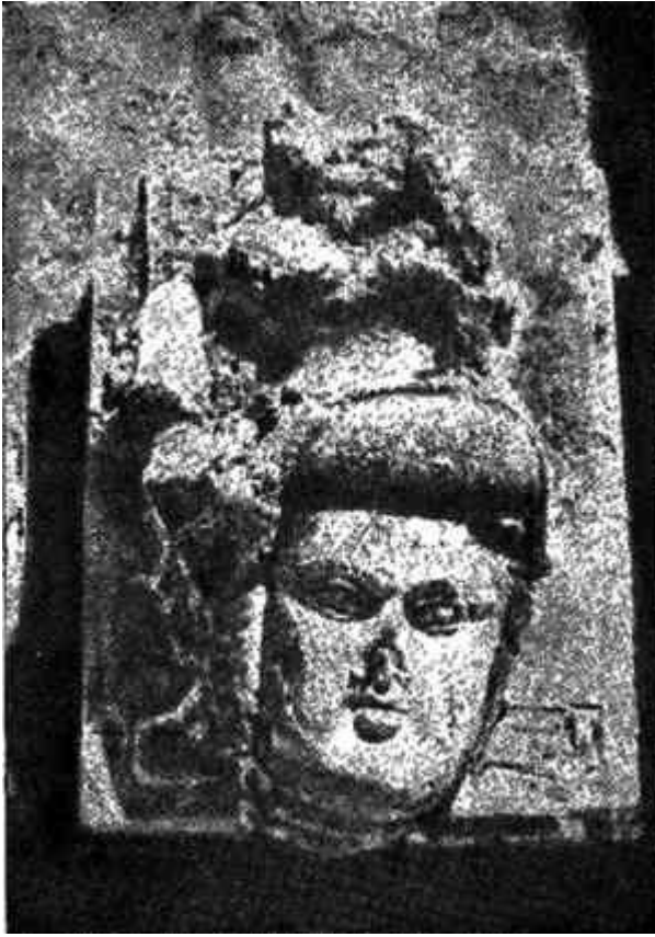
Голова супруги царя Вазамара из портретной галереи династии хорезмийских царей (III век.). Дворец Топрак-Кала