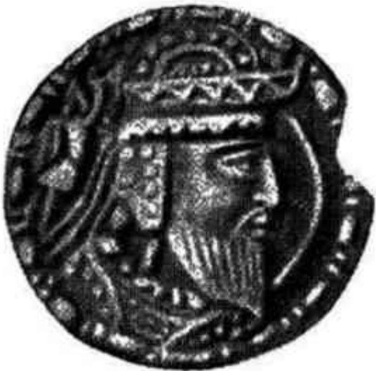
Древнейшая из известных нам хорезмийских монет