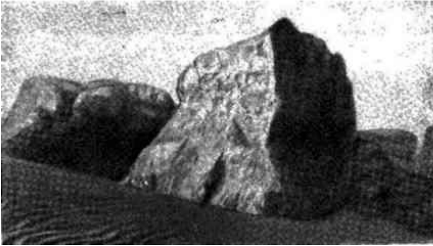
Пилоны ворот Кум-Баскан-Кала