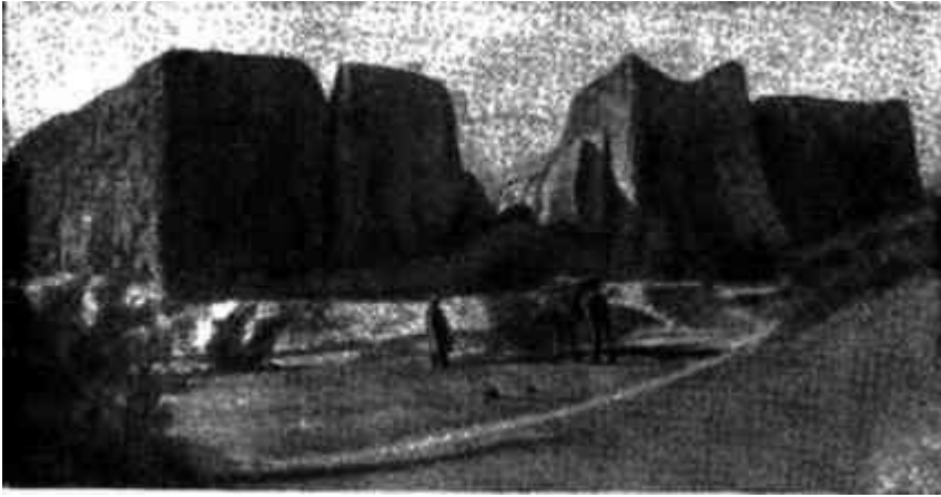
Замок № 13, эпоха Афригидов