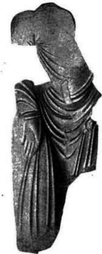
Статуя жреца из замка Топрак-Кала, найденная в Топрак-Кала