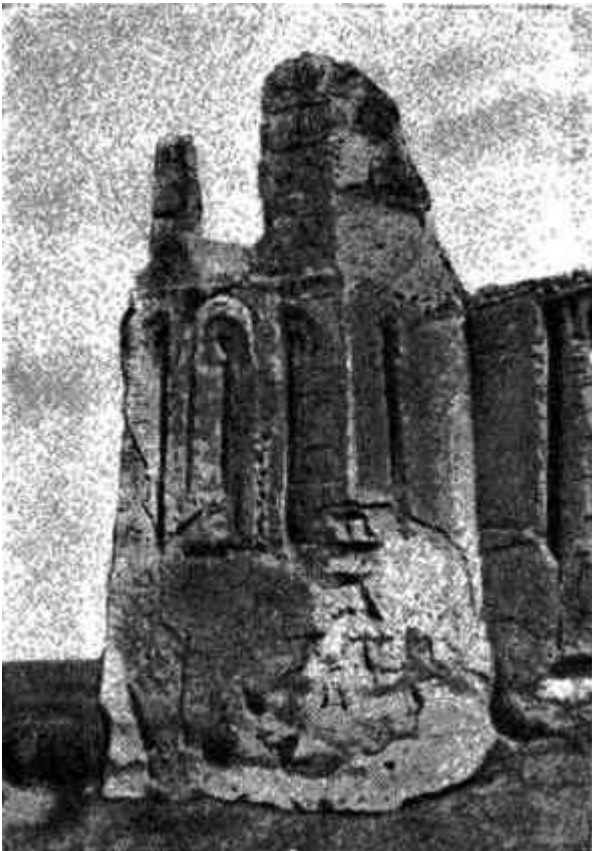
Внешний вид «Каптар-ханы» близ Наринджана (XII–XIII века)